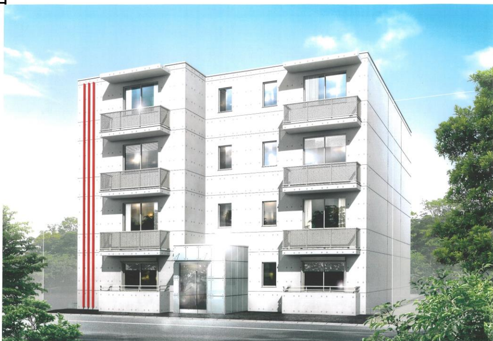
イメージパース 完成建物とは異なります