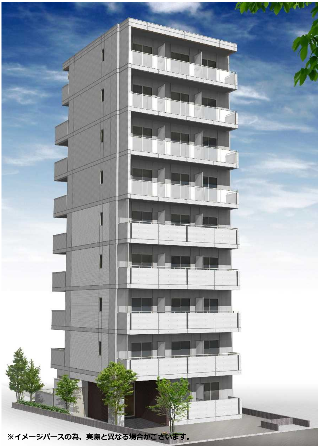
※イメージパースの為、実際と異なる場合がございます。